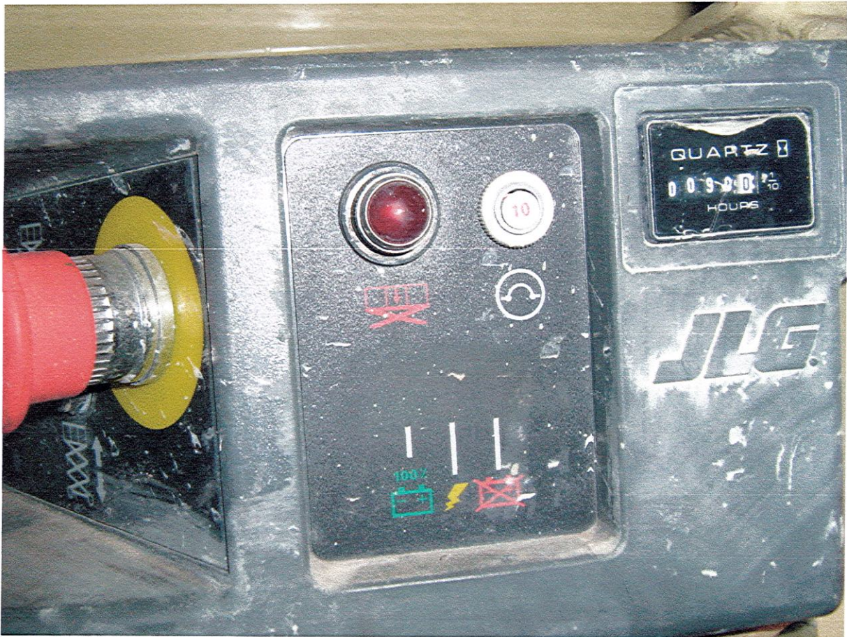
Informatie aangaande de lading van het toestel