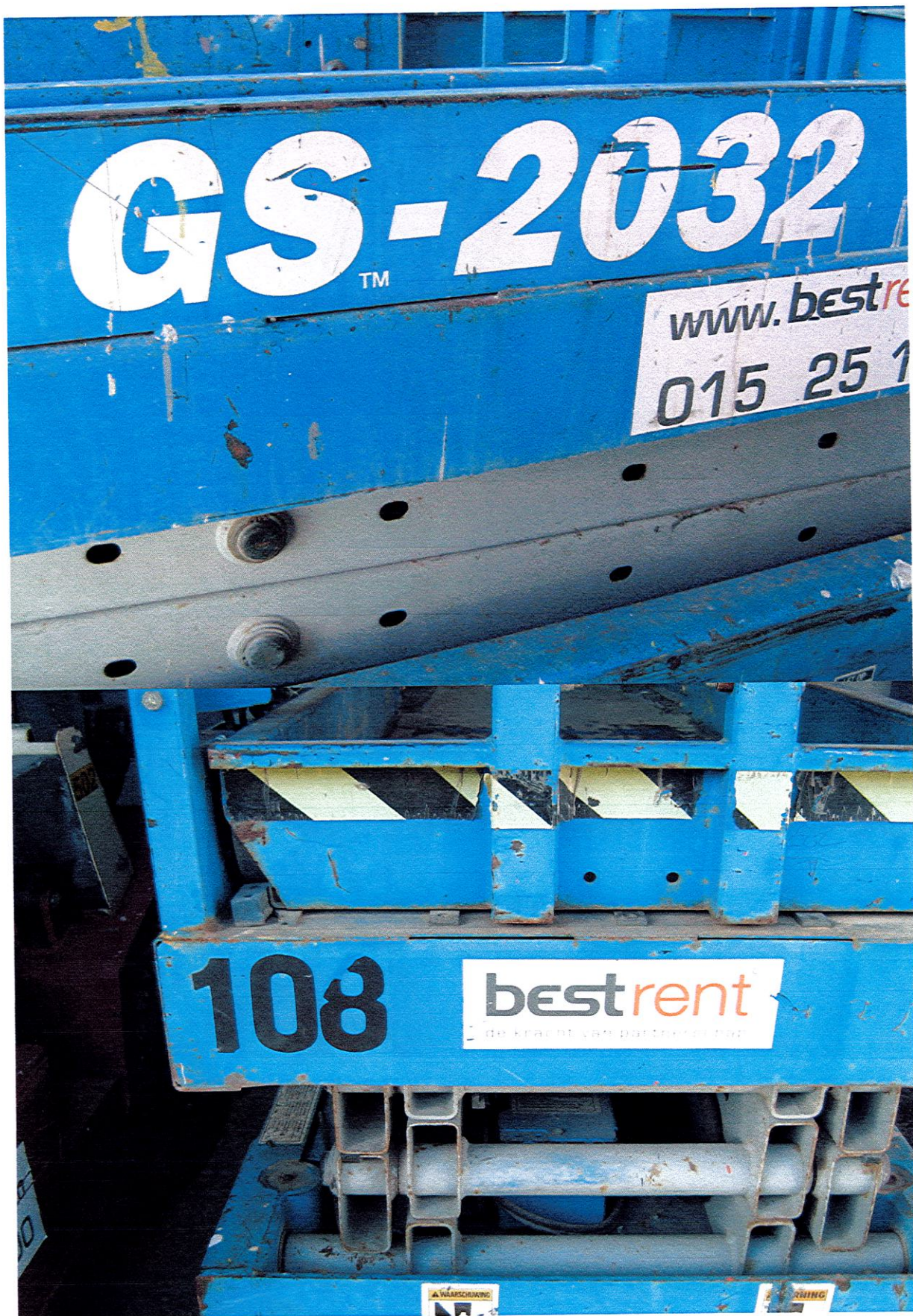
Type Genie GS-2032 + interne nummer